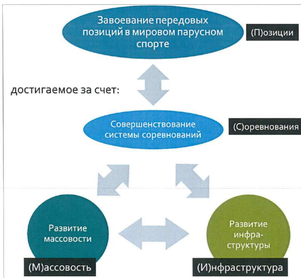
Рис. 1 – цели программы:

Наглядно цели программы и их взаимосвязь приведены на рис. 1.